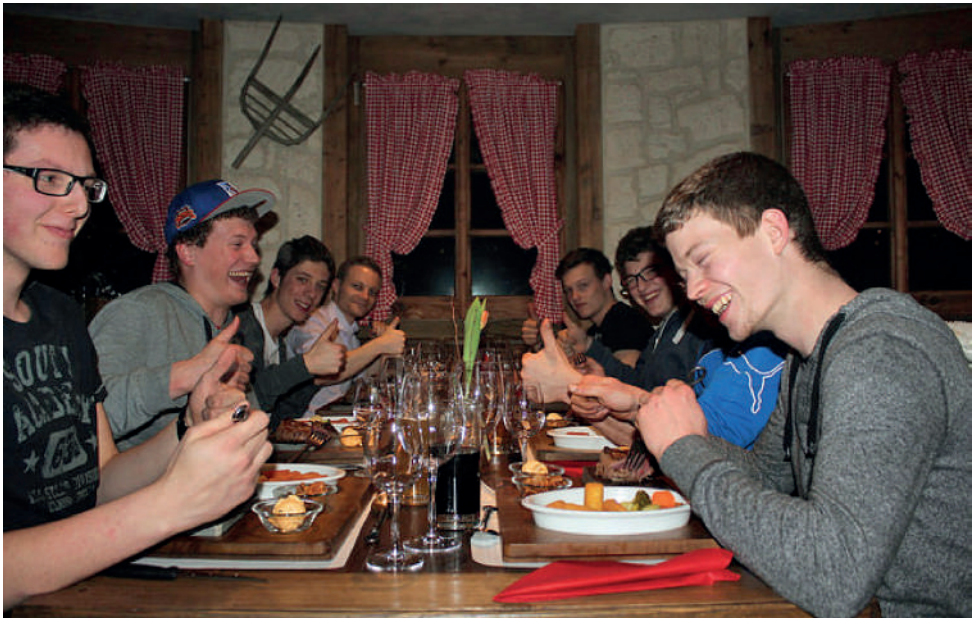
Die Daumen rauf für den heißen Stein