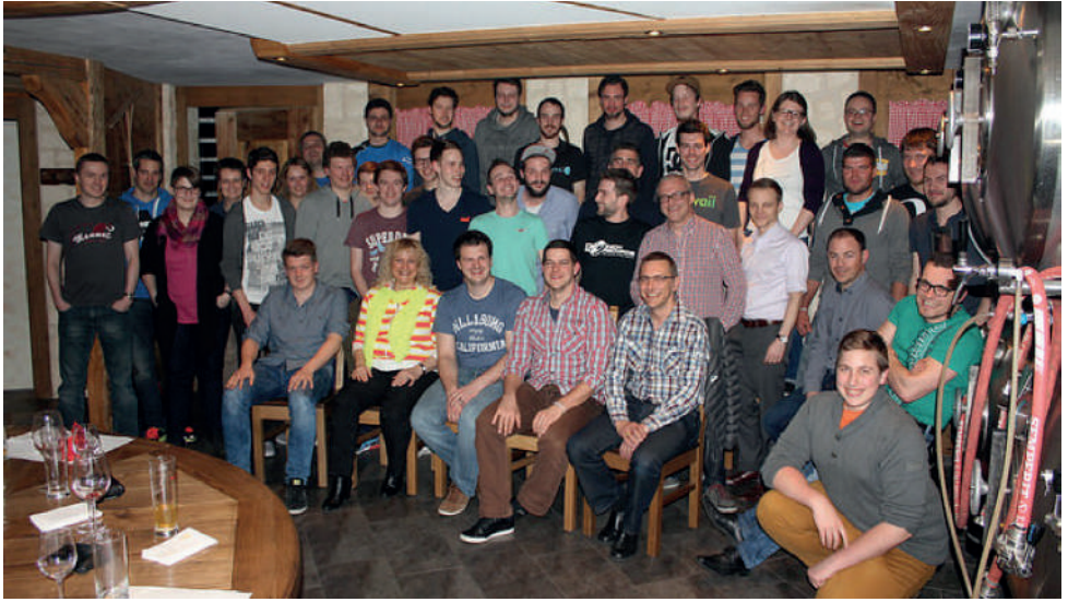
Lauter glückliche Gesichter am Helferessen