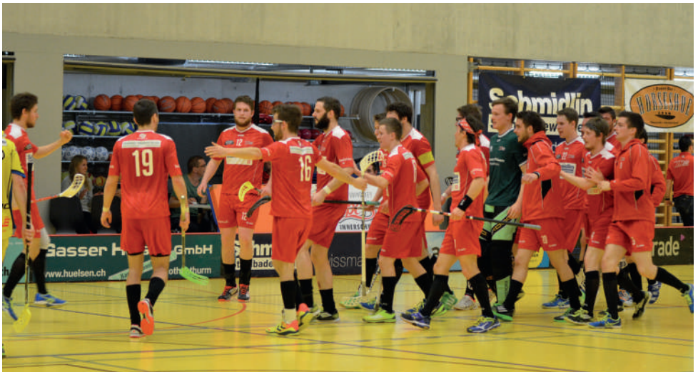
Das Herren 1 bejubelt einen Treffer an den Playoff-Finals gegen Schüpbach