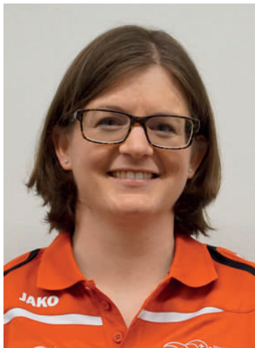
Die designierte Präsidentin im Portrait

Ich mag Herausforderungen und ich möchte etwas bewirken können. Wenn diese beiden Kriterien erfüllt sind, bin ich dabei. Bei meinem Amtsantritt vor 10 Monaten gab es in allen Bereichen dringenden Handlungsbedarf und die Frage war nicht, was ich gerne machen würde sondern was wir zuerst machen müssen. In der nächsten Saison erwarte ich etwas weniger Arbeit in dieser Hinsicht und ich freue mich, wenn ich mich dann unter die Zu-