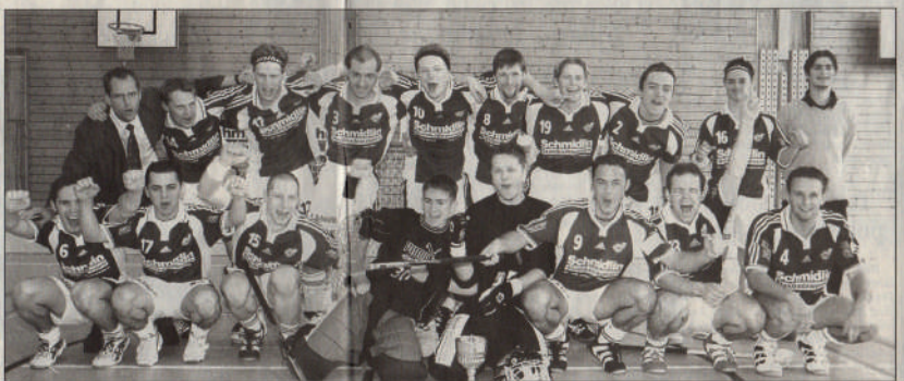
Die Vipers InnerSchwyz sind nach nur einem Jahr in der Grossfeldmeisterschaft bereits in die erste Liga aufgestiegen.

Am Sonntag zeigten sich die Vipers von einer völlig anderen Seite. Zurückführen lässt sich das wohl auf die nicht mehr vorhandene Anspannung, da man sich am Tag zuvor die beste Ausgangslage geschaffen hat. Im zweiten Spiel gegen Riehen stand es bereits zur Pause 2:0. Zwar hatte auch der Gegner einige dicke Chancen, diese wur-