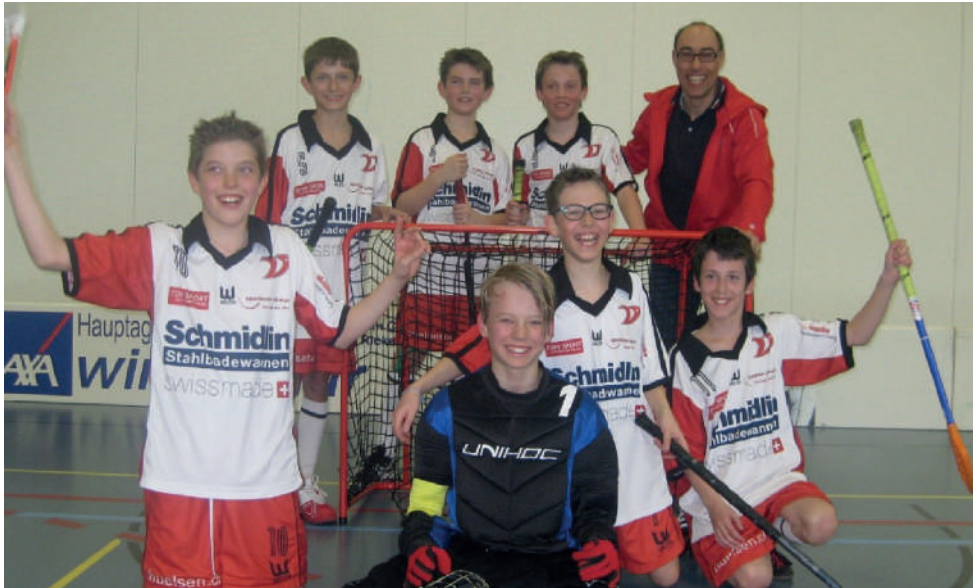
Unsere Junioren D III - auch sie haben eine erfolgreiche Saison hinter sich